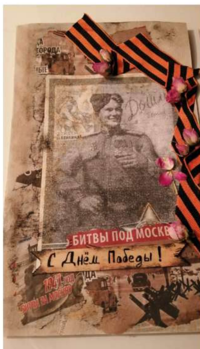
Рисунок Дanelии Магаевой

Завершилось мероприятие концертом оркестра в/ч 3737. Организаторами автопробега выступили администрация района и поселений.