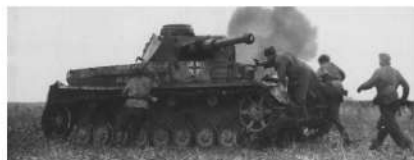
Красноармейцы у подбитого танка на поле боя в районе г. Моздока