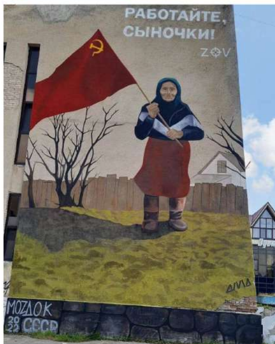
На стене бывшего кинотеатра им. С.М. Кирова появилось это графическое изображение в исполнении художника из Владикавказа Давида Цагарева.