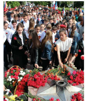
ЭТО НУЖНО ЖИВЫМ